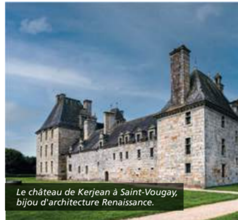
Le château de Kerjean à Saint-Vougay, bijou d'architecture Renaissance.

In Finistère, there are 14 historical towns full of treasures. Discover the region and learn about the heritage by visiting parish closes, archaeological sites, manors, castles and historical city centers.