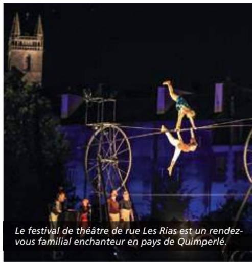
Le festival de théâtre de rue Les Rias est un rendez-vous familial enchanteur en pays de Quimperlé.