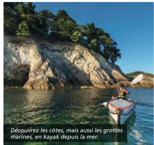
Découvrez les côtes, mais aussi les grottes marines, en kayak depuis la mer.