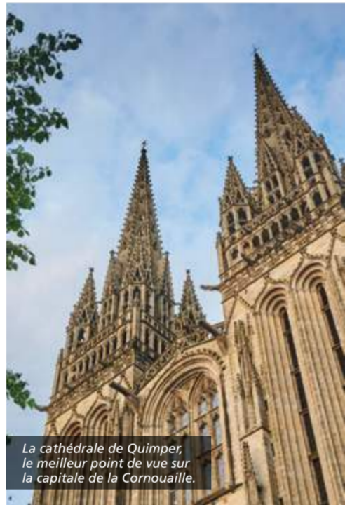
La cathédrale de Quimper, le meilleur point de vue sur la capitale de la Cornouaille.

Le Finistère ne compte pas moins de 14 cités historiques qui regorgent de trésors. Découvrez le territoire à travers son patrimoine, ses sites archéologiques, ses nombreux manoirs et châteaux, ses centres-villes historiques et ses enclos paroissiaux qui sont autant de témoignages de l'histoire du département.