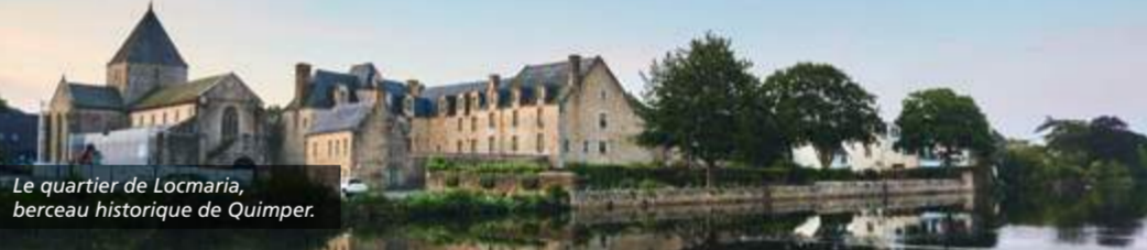
Le quartier de Locmaria, berceau historique de Quimper.