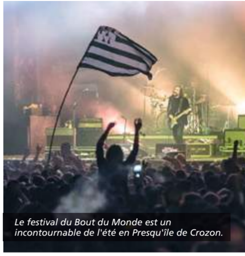
Le festival du Bout du Monde est un incontournable de l'été en Presqu'île de Crozon.

Gardiens de granit, les phares sont nombreux en Finistère. À pied depuis le GR®34, à vélo ou en voiture, on les distingue de loin, de jour comme de nuit, tout le long de nos côtes. En Iroise, cet itinéraire vous fera découvrir une importante concentration de phares. Et si certains restent inaccessibles, d'autres, ouverts au public, dévoilent leurs secrets à ceux qui en feront l'ascension jusqu'à la lanterne.