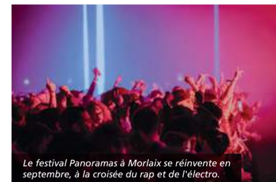
Le festival Panoramas à Morlaix se réinvente en septembre, à la croisée du rap et de l'électro.

Décembre Illuminations de Noël Locronan Noël à Meneham Kerlouan Noël à Trévarez Saint-Goazec Nuit d'Hiver Landerneau Passeurs de Lumière Quimper Pont-Aven en Lumière Pont-Aven