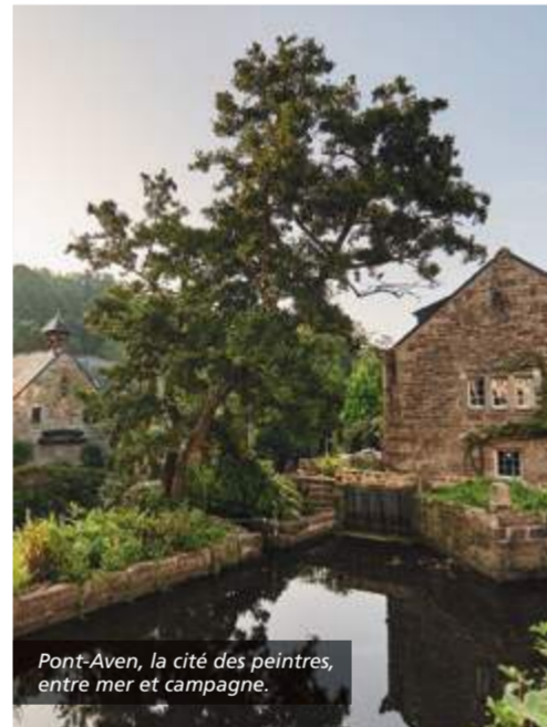
Pont-Aven, la cité des peintres, entre mer et campagne.

La Cornouaille a inspiré de nombreux artistes : Pont-Croix, Douarnenez, Châteauneuf-du-Faou, la Riviera Bretonne avec Bénodet et Fouesnant, Concarneau, Pont-Aven, Le Poullu... Suivez les traces de Gauguin, Renoir ou encore Sérusier et retrouvez les paysages et les émotions qui guideront leurs élans créatifs.