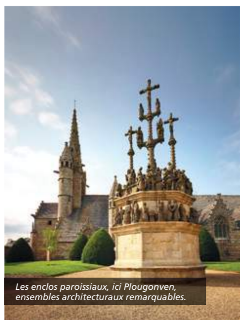
Les enclos paroissiaux, ici Plougouven, ensembles architecturaux remarquables.

Nichés au cœur du Finistère, les enclos paroissiaux représentent un héritage historique et culturel majeur. Composé d'une église, d'un mur d'enceinte, d'une porte triomphale, d'un échalière, d'un calvaire, d'un placître et d'un ossuaire, les enclos constituent un ensemble architectural unique au monde. Partez à la découverte de ces joyaux d'architecture, véritables vaisseaux de pierre, et ouvrez grand les yeux : leur beauté se niche dans leurs nombreux détails.