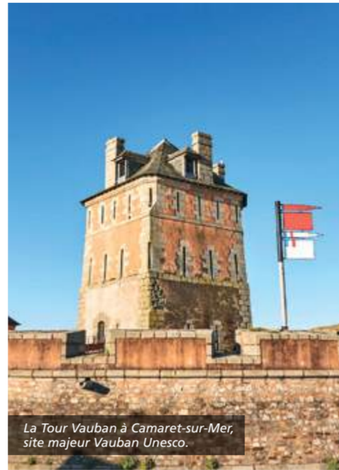
La Tour Vauban à Camaret-sur-Mer, site majeur Vauban Unesco.

Composé de 16 sites, cet itinéraire touristique vous mènera de la Tour Vauban à Camaret-sur-Mer, à la Pointe des Espagnols, en passant par le Fort du Gouin. Une promenade dans des paysages magnifiques à la découverte de l'histoire de la presqu'île, rappelant sa vocation défensive à travers les siècles.