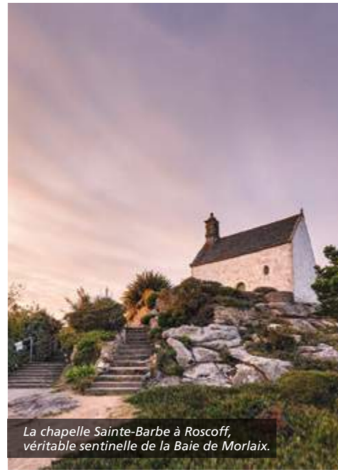
La chapelle Sainte-Barbe à Roscoff, véritable sentinelle de la Baie de Morlaix.

Finistère gets its strength from the sea. At the end of the land, water has shaped the landscapes. The power of natural elements contrast with the sweet life by the coast. All year round, you can watch the ballet of boats that come and go at the ports. Some connect the continent and the islands, others come home to unload the catch of the day. There are 2200 km (1367 mi) of coast to choose a beach from and go for a walk. Press pause and relax in one of our thalassotherapy centers. Enjoy doing water sports in the ocean, the lakes and rivers. Paddling, surfing, kayaking, sand yachting or sailing, go with the current in Finistère.