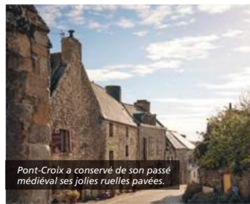
Pont-Croix a conservé de son passé médiéval ses jolies ruelles pavées.