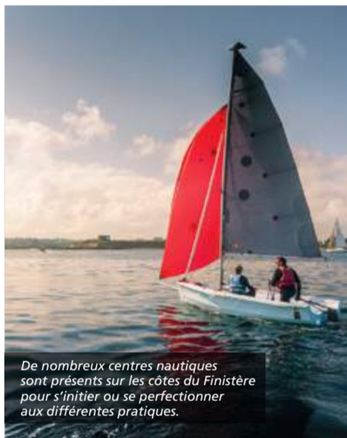
De nombreux centres nautiques sont présents sur les côtes du Finistère pour s'initier ou se perfectionner aux différentes pratiques.

Profitez-en pour faire le plein d'activités nautiques. En mer, bien sûr, mais aussi sur les lacs et les rivières qui parcourent notre territoire. En paddle, en surf, en kayak, en char à voile ou en bateau, laissez-vous porter au fil de l'eau, omniprésente en Finistère.