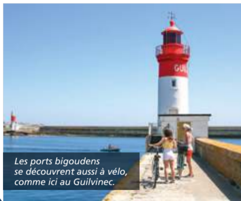
Les ports bigoudens se découvrent aussi à vélo, comme ici au Guilvinec.