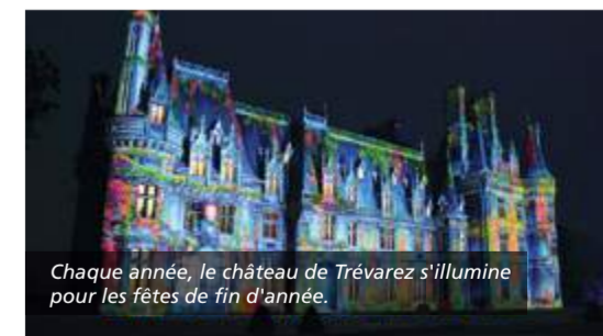
Chaque année, le château de Trévarez s'illumine pour les fêtes de fin d'année.