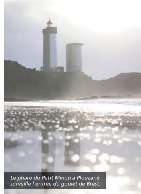
Le phare du Petit Minou à Plouzané surveille l'entrée du goulet de Brest.

De la Pointe de Penmarc'h à la Pointe du Raz, la route du Vent Solaire arpente la Baie d'Audierne et vous mènera sur les nombreux lieux d'exception qui la jalonnent. De l'immense plage de La Torche à l'étang de Trunvel, aux chapelles de Tronoën et de Languidou, ce circuit traverse des paysages tantôt marins, tantôt ruraux, à la découverte d'un patrimoine préservé et authentique.