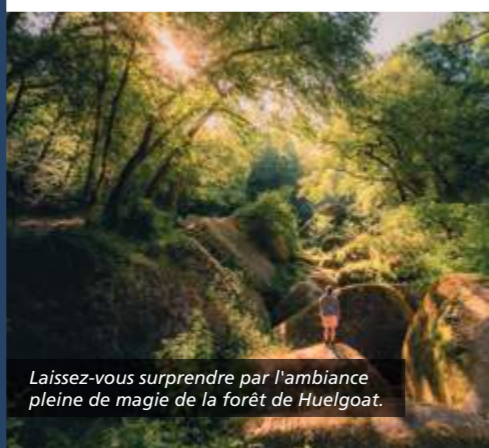
Laissez-vous surprendre par l'ambiance pleine de magie de la forêt de Huelgoat.

Le Finistère est le terrain de jeu idéal pour les activités de plein air : escalade, accrobranche, course d'orientation, équitation, trail, VTT ou encore randonnée. Empruntez le GR®34 fameux Sentier des Douaniers longeant les côtes, le GR®37 ou GR®38 pour une découverte des paysages intérieurs verdoyants, ou encore l'un des GR® de Pays... De nombreuses idées de circuits à retrouver dans les topoguides® de la Fédération Française de la Randonnée Pédestre. finistere.ffrandonnee.fr